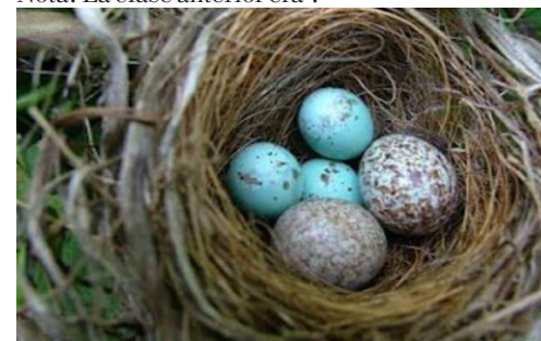
Postura de Aves haciendo Parasitismo